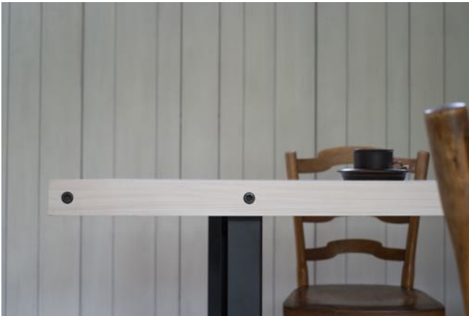
huis-werk-tafel Marie-José Van Hee