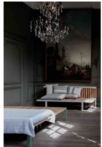
Een Meubel is ook een Huis Curator: Katrien Vandemariere